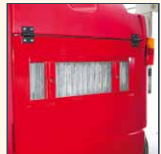
SACK FILTER SACKFILTER FILTERZAK