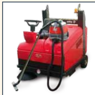
VACUUM CLEANER STAUBSAUGER STOFZUIGER