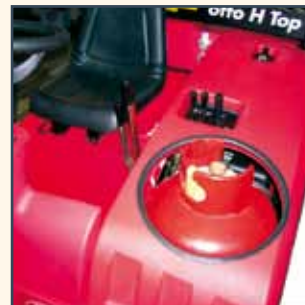
LPG SYSTEM LPG-ANLAGE GPL